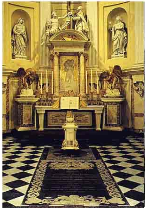
Hoogkoor met grafsteen van Philips van Montmorency.

De kerkfabriekraad besloot op 7 januari 1849 om ter bevordering van de goede orde in de kerk op zon- en feestdagen en bij bijzondere gelegenheden een suisse of stafdrager aan te stellen. De kerkmeesters zouden zorgdragen voor de aanschaf van een gepast kostuum voor de suisse, die een jaarlijkse bezoldiging van 30 gulden zou genieten 110 .