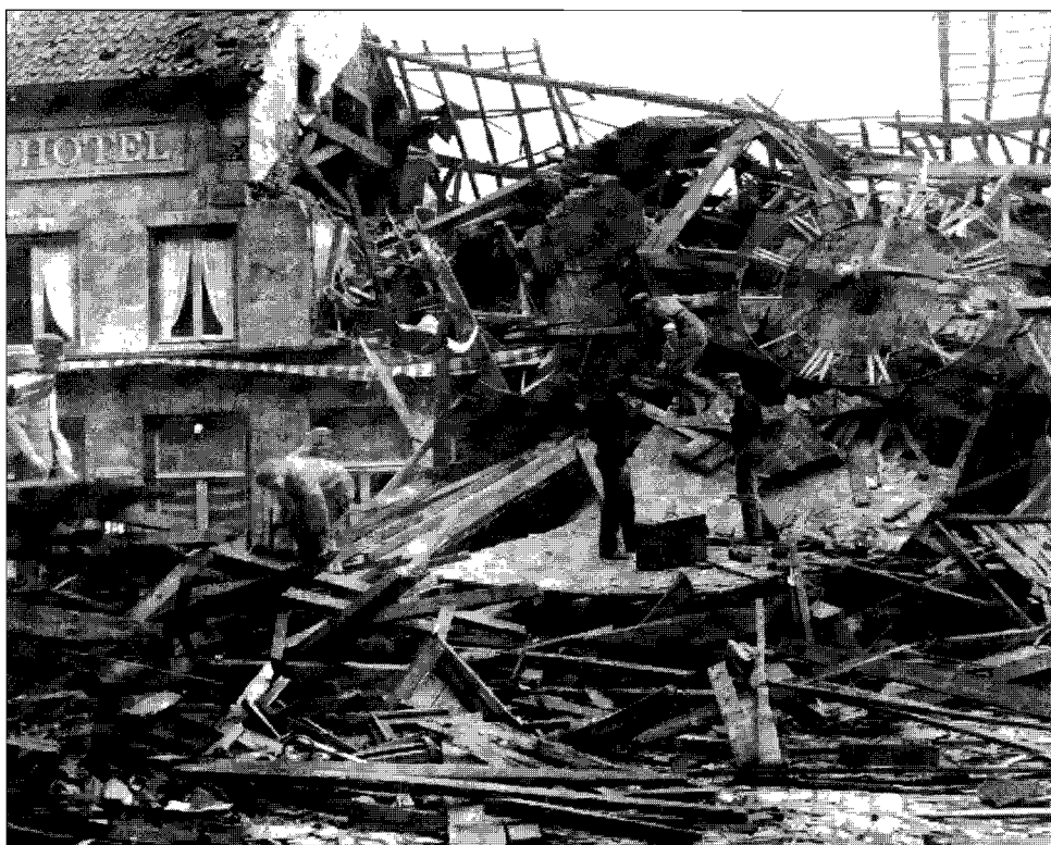
De ravage na de val van de torenspits op 14 november 1940.

In de vroege morgen van 14 november 1940 waaide tijdens een hevige storm de torenspits van de St.-Martinuskerk om en sleurde in zijn val een der vier pinakels en een gedeelte van de balustrade mee. De pinakel viel door het gewelf en veroorzaakte een gat in de vloer van de kerk. Een gedeelte van de spits viel op hotel De Vesper dat ernstig werd beschadigd. Eén hotelgast raakte daarbij gewond. In verband met de ravage in de kerk werden missen gelezen in de St.-Jozefskapel en in de kapellen van het St.-Jans Gasthuis, het Bisschoppelijk College en de paters van de H. Geest 146 . In 1940 en 1941 werden daken, gewelven en vloer hersteld, terwijl de toren provisorisch gerepareerd werd 147 .