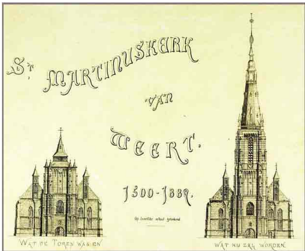
Bijlage van het Kanton Weert in verband met de verhoging van de toren 1887-1889.

1886 werden in de kerk nieuwe lampen ontstoken en vóór Pasen werden twee nieuwe godslampen opgehangen. In 1886 werden ook de voorgevels en het onderstuk van de toren hersteld, waar het woonhuis en de vleeshal tegenaan hadden gestaan 127 .