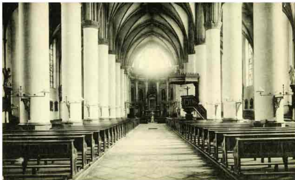
De gepleisterde pilaren vóór 1921.