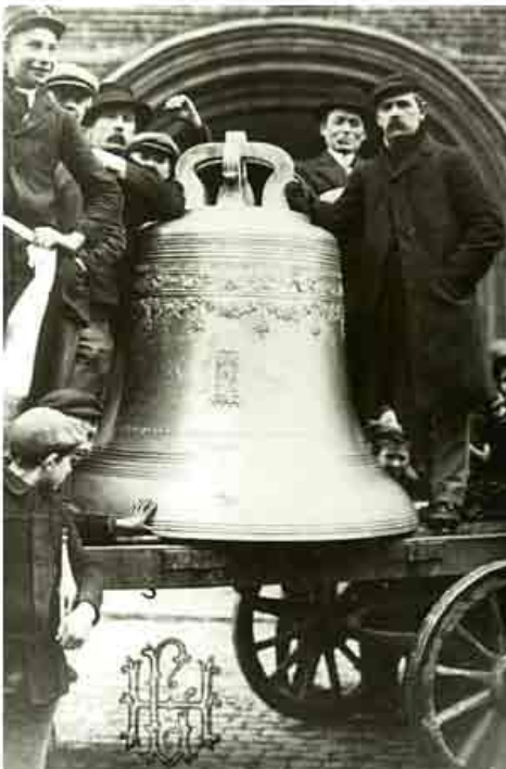
Door Michaux in 1912 hergoten klok "Jezus Maria".

Het kerk- en gemeentebestuur sloten in juni 1882 een overeenkomst waarbij het gemeentebestuur zich verplichtte op eigen kosten de vleeshal te slopen aan de zuidzijde van de toren, terwijl het kerkbestuur op eigen kosten het vermoedelijk in 1652 gebouwde woonhuis aan de noordzijde van de toren zou slopen 125 .