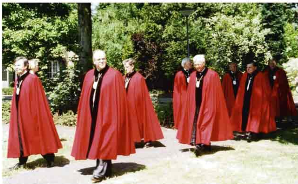
De leden van de heropgerichte broederschap van O.L. Vrouw in actie.

Doordat de gewelfschilderingen in de kerk sterk verontreinigd zijn en los begonnen te raken van de ondergrond, is restauratie dringend noodzakelijk geworden. De restauratie van acht glas-in-loodramen, die eveneens noodzakelijk was geworden, is in de loop van 1998 voltooid 165 .