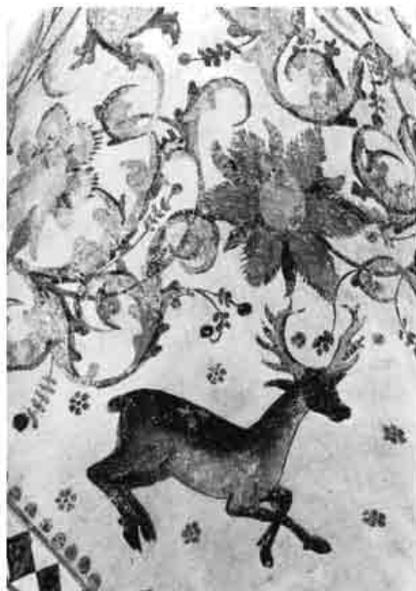
Gewelfschildering in het middenschip.

Vervolgens liet de commissaris aan de Minderbroeders weten dat zij binnen twintig dagen hun klooster moesten verlaten, anders zou geweld worden gebruikt. In deze periode konden tal van kostbaarheden aan confiscatie onttrokken worden. Begin februari kwam de commissaris met 29 jagers en 9 dragonders naar Weert en verleende uitstel tot 9 februari, op welke dag de paters het klooster moesten verlaten en de gemeenschap