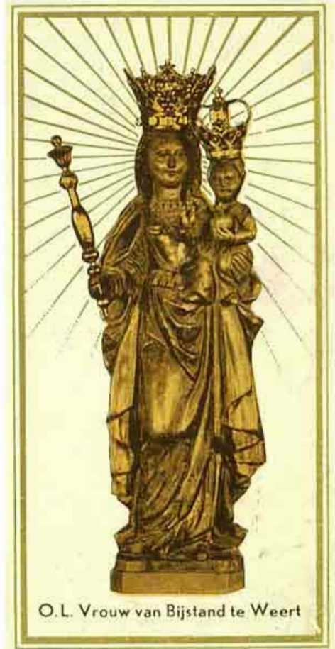
Prentje van O.L. Vrouw van Weert.

Bij de bul 'Pia Deo' van 2 juni 1461 gaf paus Pius II aan Lodewijk van Bourbon, bisschop van Luik, opdracht om aan graaf Jacob I verlof te verlenen om in Weert een klooster met kerk voor de Minderbroeders te stichten. Op 30 oktober gaf de bisschop de vereiste volmacht en reeds op 1 november werd het huis De Aldenborch door Jacob I aan de Minderbroeders overgedragen en konden zij de hun aangewezen plaats betrekken. In 1461-1462 werd vermoedelijk slechts een kleine kerk ingericht, die op 30 mei 1462 tegelijk met het kerkhof door Judocus Borre, bisschop van Hiëropolis en wijbisschop van Utrecht, werd geconsacreerd. De kerk was toegewijd aan de H. Hiëronymus, het hoofdaltaar aan O.L. Vrouw, het altaar aan de zuidzijde aan de H.H. Franciscus, Antonius, Ludovicus, Bernardus en Clara, en dat aan de noordzijde aan de H.H. Catharina, Barbara, Cecilia en Agnes. Bij die gelegenheid schonk Jacob I ook nog een stuk grond met twee vijvers buiten de grachten ter vergroting van de tuin. Op 9 maart 1489 kregen de Minderbroeders wederom een stuk grond, in dit geval van graaf Jacob II, ter vergroting van het kloosterterrein en met name het kerkhof. Op 8 september 1512 verleenden Jacob III en zijn vrouw Margareta van Croy toestemming voor het vergroten der kerk. In 1526 werd de vergrote kerk, die zes altaren telde, geconsacreerd 12 .